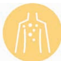
Více mateřských znamének