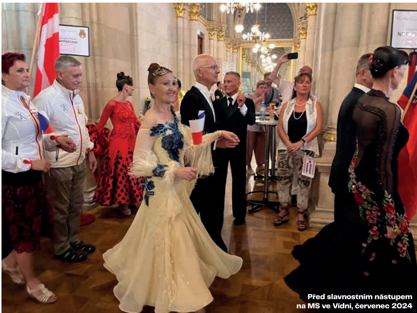
Před slavnostním nástupem na MS ve Vídni, červenec 2024

Jan: Jsme čtyřnásobní mistři republiky v kategorii senior IV, v kategorii senior III jsme byli na mistrovství třikrát čtvrtí a toho si velmi ceníme, protože tam je už registrovaných 37 párů. Ve světovém žebříčku se nám podařilo