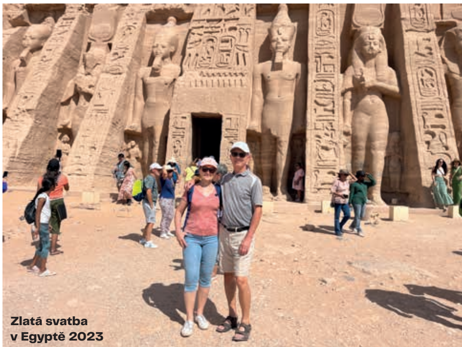
Zlatá svatba v Egyptě 2023