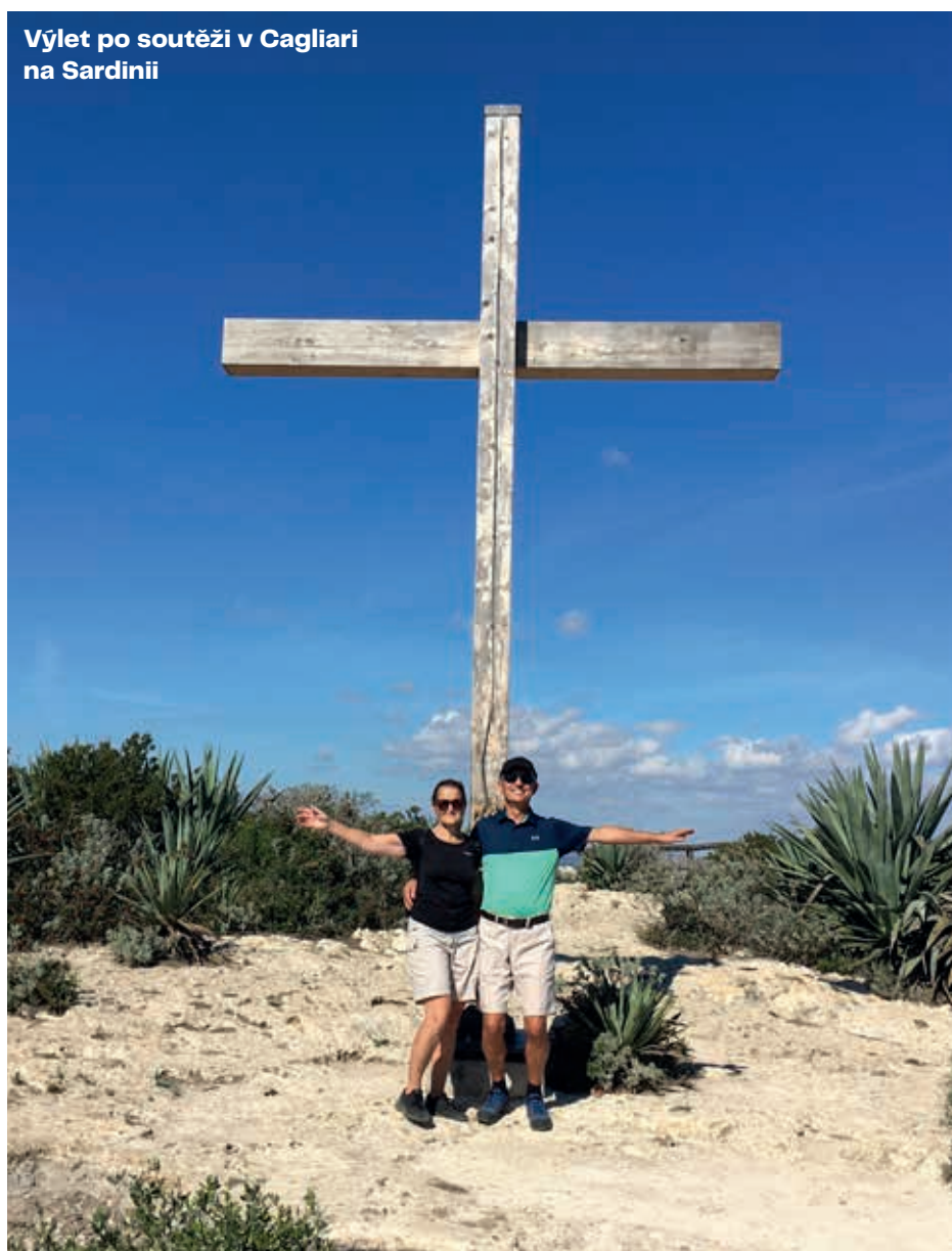
Výlet po soutěži v Cagliari na Sardinii

nestydět se za to, že něco umíme, a umět to takzvaně „prodat“. V tanci je tato schopnost velice důležitá a té jsme se museli hodně učit a stále se učíme. K tomu nám pomohly hlavně první úspěchy.