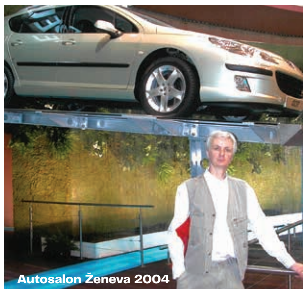
Autosalon Ženeva 2004