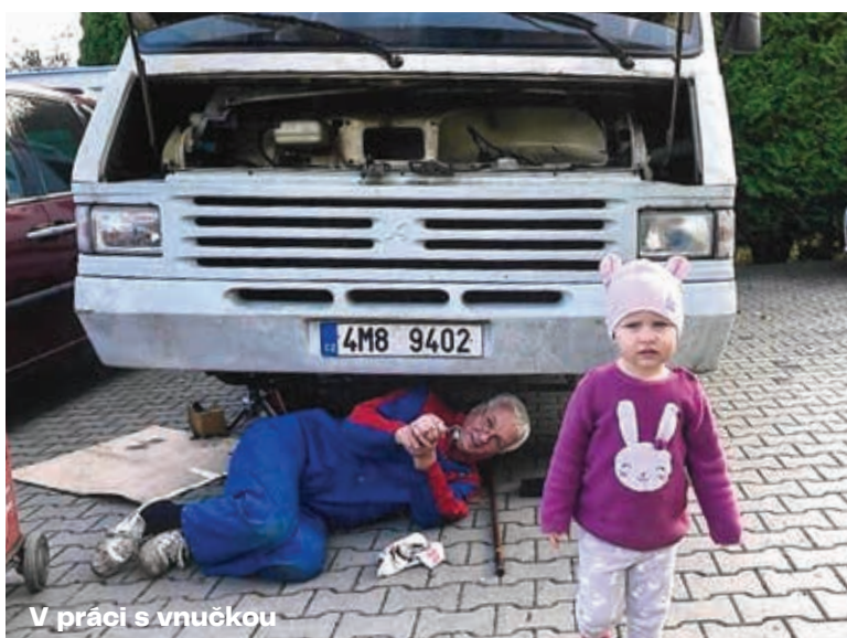
V práci s vnučkou