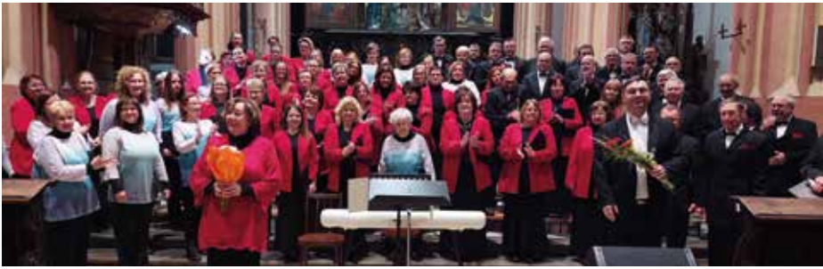
Společné vystoupení v Mořici se sborem z Banské Bystrice