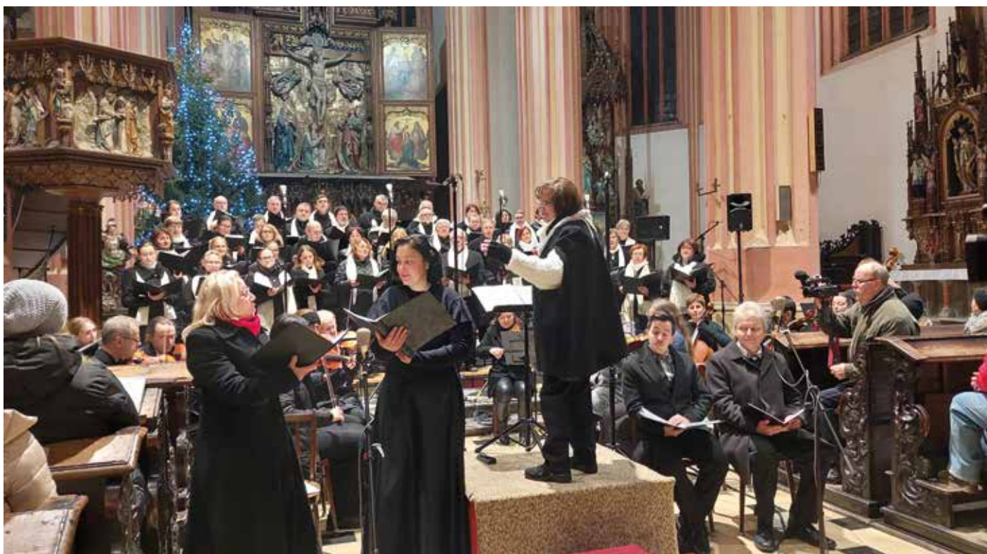
Komorní sbor v Mořici

Vežmu to zeširoka. Celý sbor pracuje na společné věci, baví je to, mají k tomu předpoklady. Ale potřebují také vědět, že se jim daří, že jsou (aspoň částečně) úspěšní. Takže to dělají pro sebe, ano, ale také pro publikum. A teď si představte, když zpíváte před porotou, anebo plným kostelem. Porotci hodnotí, hledají chyby – vždycky tam nějaké jsou, samozřejmě. Je to jejich práce. A v kostele to nadšení lidí! Na vánočních koncertech zpívají často s námi.