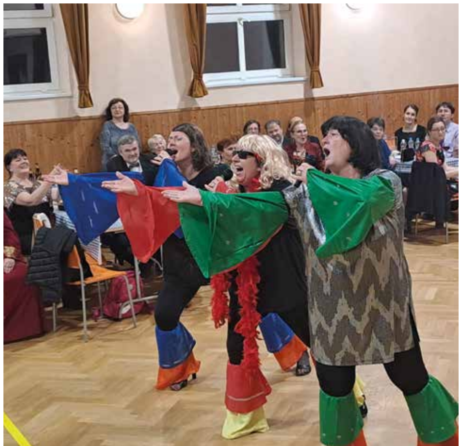
Společenský večer, scénka Mamma Mia