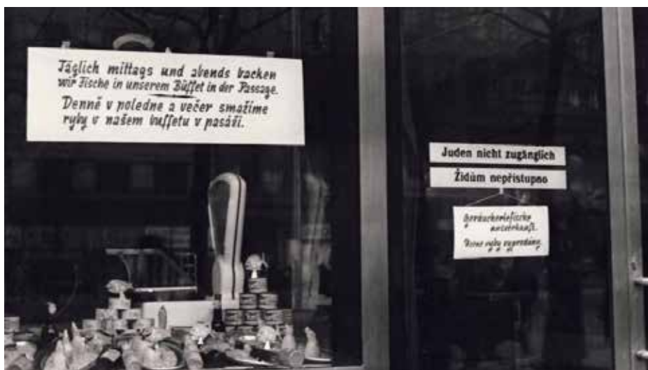
Židům nepřístupno