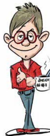
Maskot kampaně Prokoukl